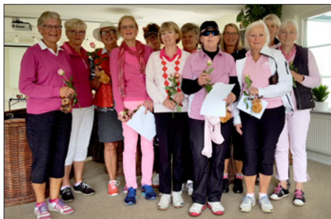
Lag Bosjö DK