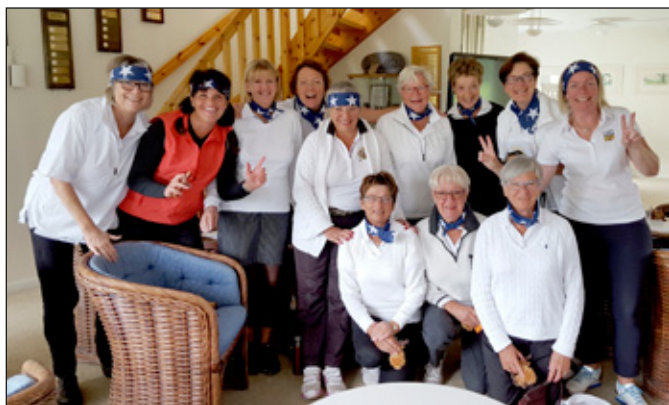
Lag Kloster DK