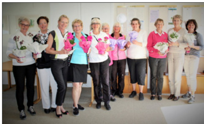
Pristagare Vårtävling DK