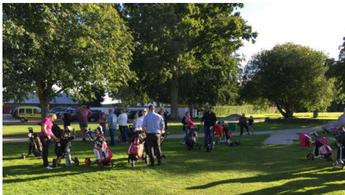
Nervösa föräldrar förbereder sig för match på korthålsbanan mot våra juniörer. Man förstår varför när man ser resultaten. Juniörerna 7 ½ - föräldrar 3 ½.

Juniörerna har under 2016 haft en omfattande verksamhet med många deltagare, nya så väl som gamla. På hemsidan finns en hel del att läsa och fler foton.