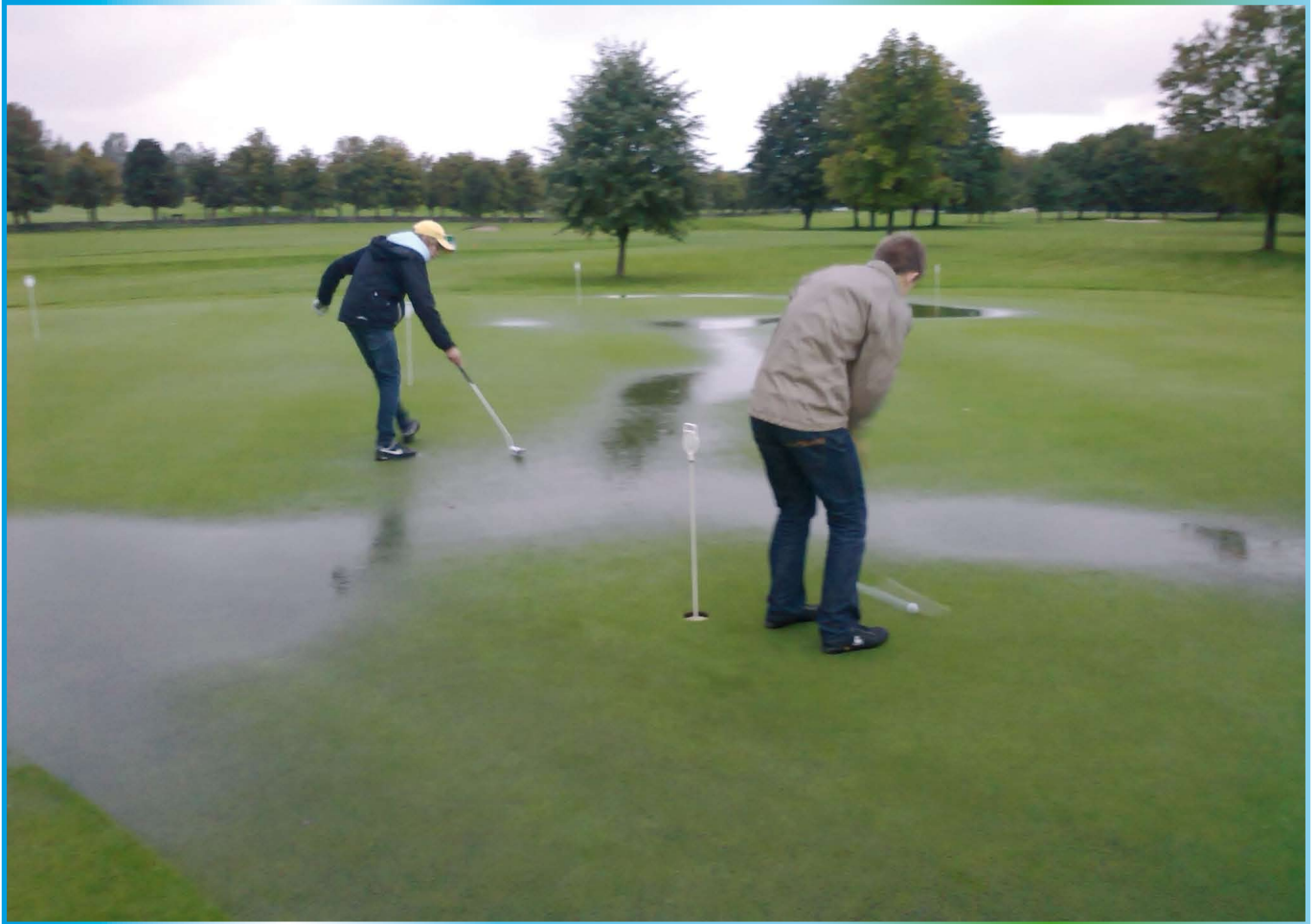
Bosjökloster GK 15 september 2010

Har Du några roliga, spännande eller vackra bilder från golfrundan? Skicka in, så gör vi en kul bildsida!