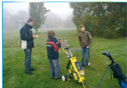
Juniorträning hösten 2010 Foto: Fredrik Persson.

Har du frågor eller vill ha mer information, så ring Fredrik Persson, 070 5980298