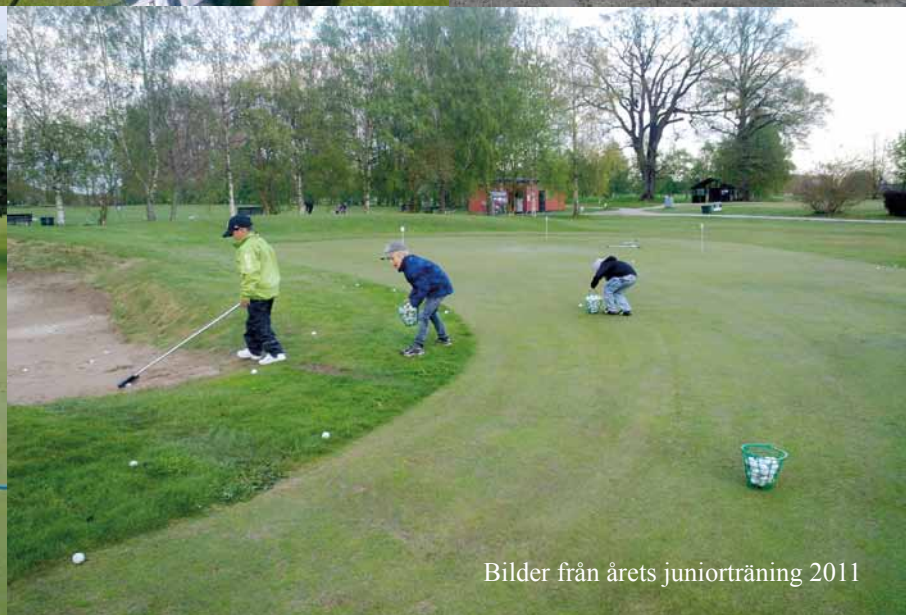
Bilder från årets juniorträning 2011