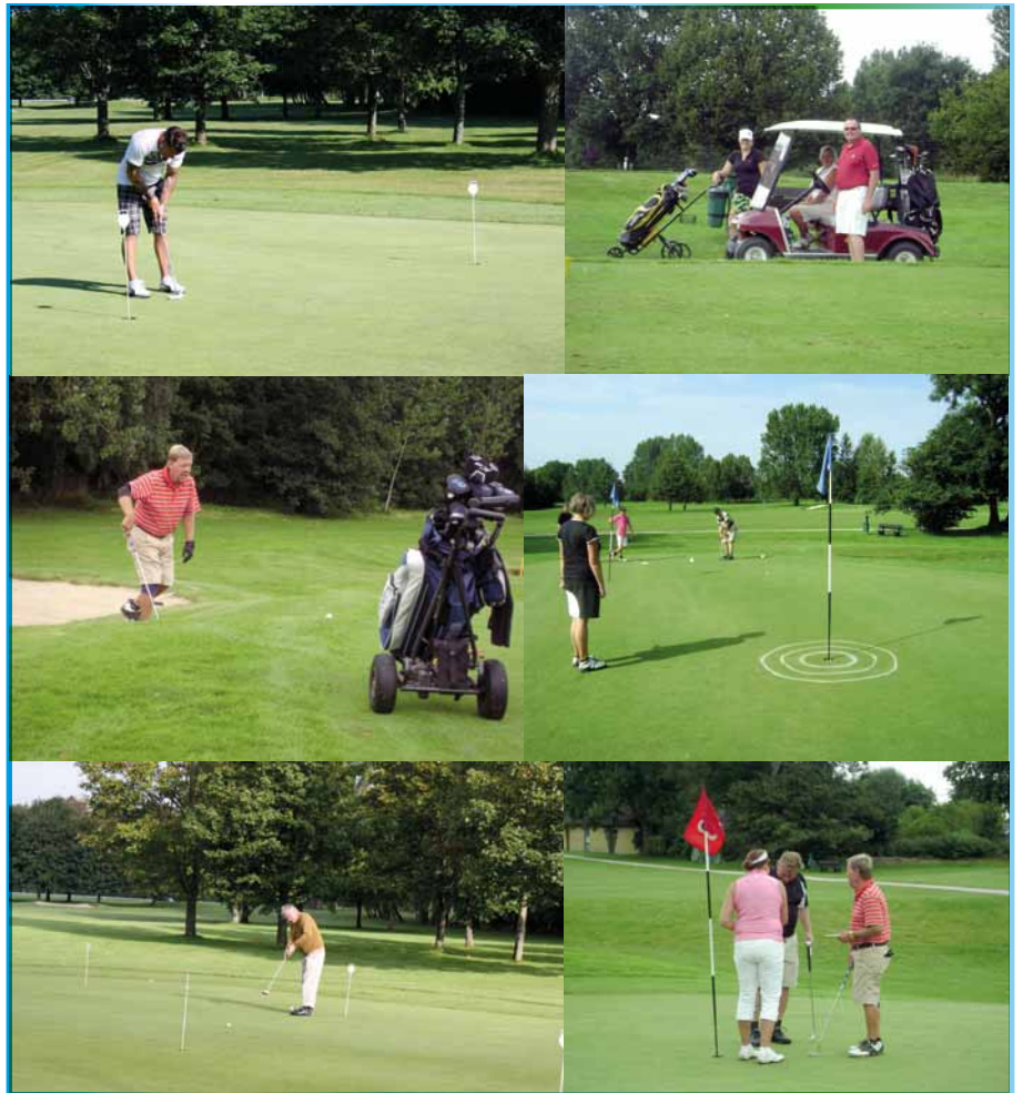
Blandat från ett par av årets tävlingar

Två nya tävlingar har infogats i år, Mårtenssons tvåmanna-scramble och Håsab Recyclings höstslag, båda med god uppslutning. Cancerfondsgolfen i början av augusti samlade som vanligt många deltagare, men här kommer konceptet möjligen att ändras inför framtiden. Huvudarrangören, dvs Cancerfonden, har