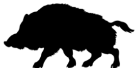
Rygården - Close up and personal

Rygården – Rökeri och viltslakteri Viltkött – Klart för grytan eller grillen Fasan And Hjort Rådjur Vildsvin